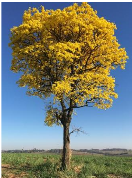
Figura 6 Ipê amarelo