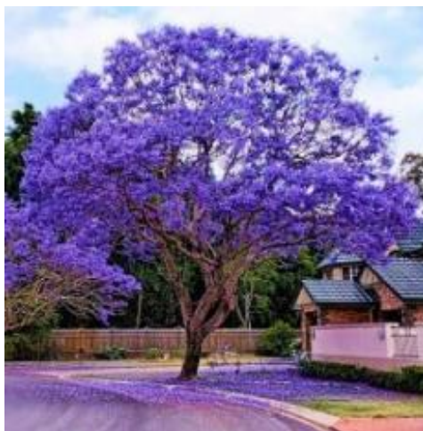
Figura 4 Jacarandá Mimoso