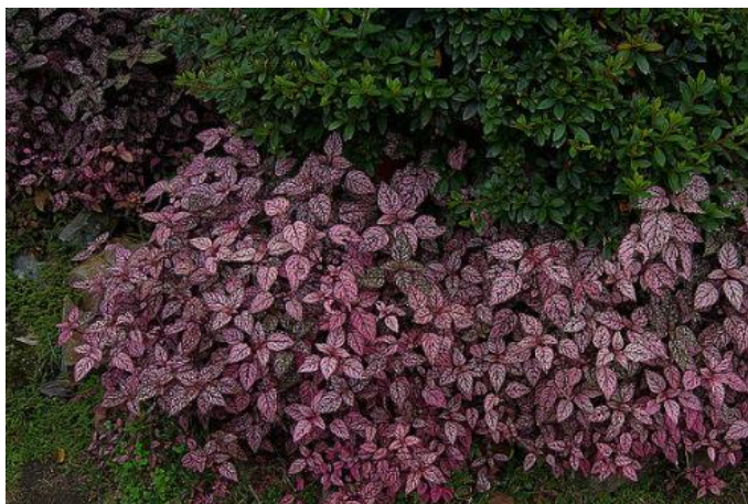
Figura 2 Confete