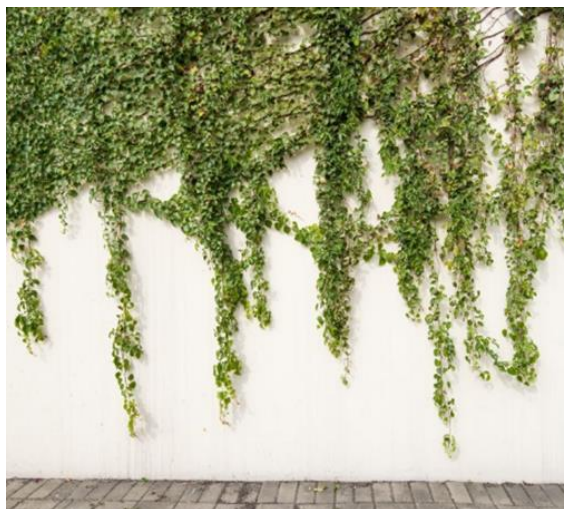
Figura 3 Hera

Rua Miguel Procópio Kurpel, 3811 Bairro São Miguel - 85560-000