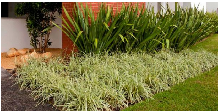
Figura 1 Clorofito

Rua Miguel Procópio Kurpel, 3811 Bairro São Miguel - 85560-000